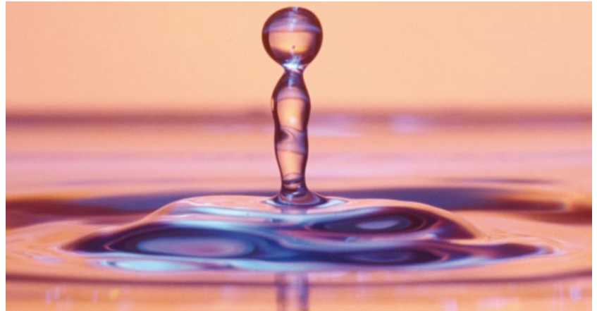
ABBILDUNG 1: Ein attraktives Aufmacherfoto lenkt die Aufmerksamkeit auf Ihren Artikel.

Die Beiträge sollten wenn irgend möglich eine Länge von 6 – 8 Schreibmaschinenseiten (12 Punkte-Schrift) nicht überschreiten. Dies entspricht, je nach Anzahl der Abbildungen und Tabellen, ca. 4 – 6 Druckseiten. Die Abbildungen und Tabellen können – wo nötig und sinnvoll – farbig gestaltet werden.